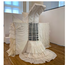
La tisseuse d'âme

Les classes de DTMS option technique de l'habillement et de MCECP entretien des collections du patrimoine du lycée des métiers La Source de Nogent-sur-Marne, en collaboration avec l'artiste vidéaste Luc de Banville, ont élaboré une reconstitution d'un métier à tisser, composée de boîtes de conditionnement et habillée d'un tissu avec différentes techniques de fermeture (laçage, corset, fermeture éclair, etc.).